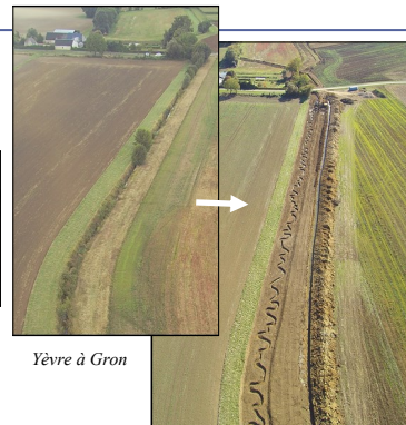
Yèvre à Gron