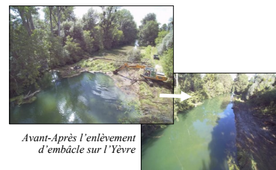
Avant-Après l'enlèvement d'embâcle sur l'Yèvre