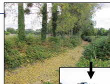
Yèvre à Avord

L'étude bilan du Contrat Territorial 2012-2016 du bassin du Barangeon a fait l'objet d'une réécriture puis d'une validation de son cahier des charges au printemps, la consultation des entreprises réalisée en juin/juillet étant infructueuse, une nouvelle consultation nationale sera réalisée en novembre.